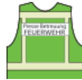
Fachberater (Chemie, Notfall-Seelsorger, Pressesprecher)