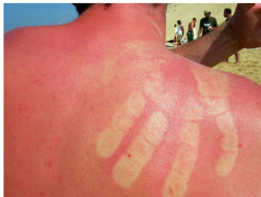
Intensive Sonneneinstrahlung gilt als Hauptursache für Hautkrebs.

Neben all den oben genannten Formen einer Überhitzung ist der Sonnenbrand eine Folge von andauernder Sonneneinstrahlung, die wohl fast jeder schon am eigenen Leib erfahren musste. Dabei darf man jedoch nicht vergessen, dass es sich bei einem Sonnenbrand um eine Verbrennung handelt, die nicht unterbewertet werden darf. Ein schwerer Sonnenbrand kann nicht nur große Schmerzen, sondern auch Blasen zur Folge haben. Bei großflächigen oder starken Verbrennungen der Haut durch direkte Sonneneinstrahlung ist auf alle Fälle ein Arzt aufzusuchen. Häufige Sonnenbrände können noch Jahre später Hautkrebs hervorrufen.