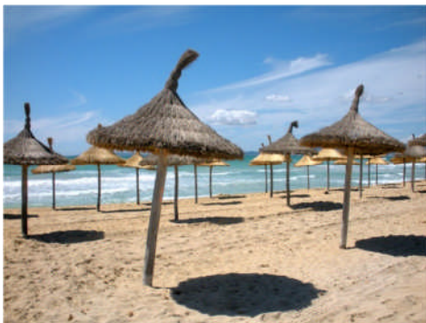
In der Notfallmedizin werden verschiedene Arten der „Hyperthermie“ unterschieden.

Im Normalfall kann der Körper durch das Weitstellen von Gefäßen, aber vor allem durch Schwitzen die eigene Temperatur regulieren, ungeachtet der äußeren Umstände. Beim Schwitzen wird Schweiß (im Extremfall über 1 Liter pro Stunde) mittels Schweißdrüsen an der Hautoberfläche produziert. Der Schweiß verdunstet und kühlt damit den Körper ab. Ist der Körper jedoch für längere Zeit einer intensiven Hitze ausgesetzt, kann er seine Fähigkeit verlieren, effektiv und schnell zu reagieren. Infolgedessen kann es zur so genannten Hyperthermie kommen.