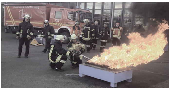
Bild: Übung mit Schaumtrainer