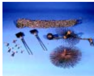
Bild 5: Schornstein-Werkzeugsatz (Beispiel aus der Beladung LF 16)

Den Kaminbrand selbst grundsätzlich nicht mit Löschmitteln bekämpfen