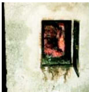
Bild 6: Kamintürchen mit Glut gefüllt

Dichtheit der Feuerstättenanschlüsse kontrollieren.